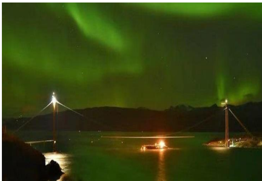
武船集团为挪威萨尔马集团制造的世界首座深海渔场“海洋渔场一号”

2024年，中国企业在挪威新签承包工程合同1份，新签合同额1.92亿美元，完成营业额1.4亿美元。累计派出各类劳务人员615人，年末在挪威劳务人员386人。