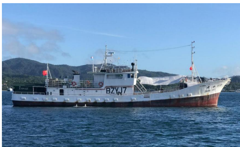
以斐济为基地，在斐济周边海域作业的中水公司渔业船舶