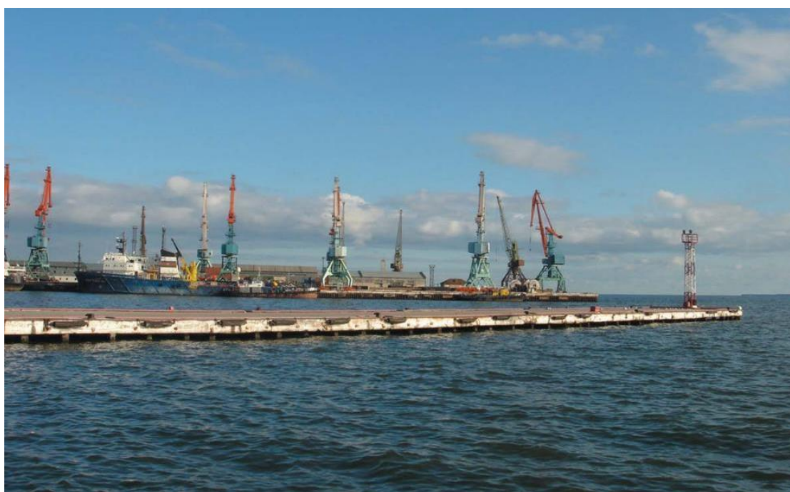
巴库港——里海最大港口

巴库港总体经营状况良好，与土库曼斯坦、哈萨克斯坦、伊朗、格鲁吉亚等国业务合作较为密切。港口超过80%货运为哈、土两国过境货物，与阿克套港（哈）、土库曼巴希港（土）有集装箱运输航线，装卸时效17-19箱/小时。2024年，巴库港转运货物约760万吨。