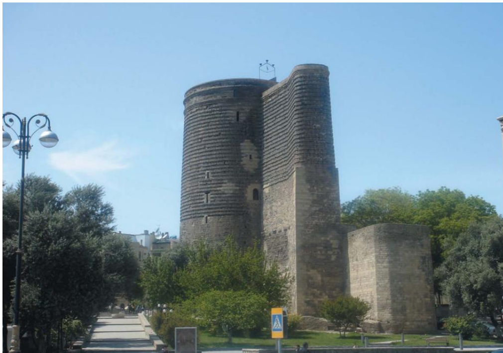
巴库最著名的古迹、世界文化遗产——少女塔

阿塞拜疆居民主要信奉伊斯兰教（什叶派），但不强调教派间差异。俄罗斯、亚美尼亚、格鲁吉亚等少数民族信奉基督教。穆斯林重要节日如“古尔邦节”“开斋节”“纳乌鲁兹节”（春节）以及俄罗斯、东欧节日等都是法定公众假日。