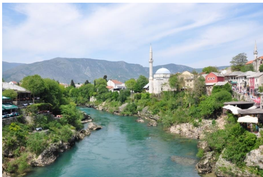
莫斯塔尔市的内雷特瓦河畔风光

其他主要城市有图兹拉（煤电和化工业）、泽尼察（钢铁产业）、多博伊（农业及食品加工）。