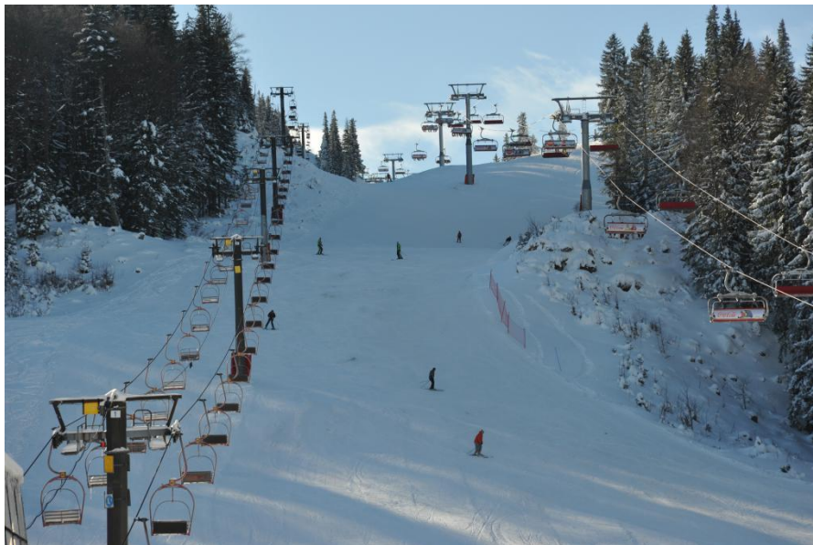
波黑萨拉热窝滑雪场

系以及签署航空服务协定事开启谈判和商签工作。2018年12月，中国与波黑在北京签署《中华人民共和国文化和旅游部和波斯尼亚和黑塞哥维那对外贸易和经济关系部关于中国旅游团队赴波斯尼亚和黑塞哥维那旅游实施方案的谅解备忘录》。