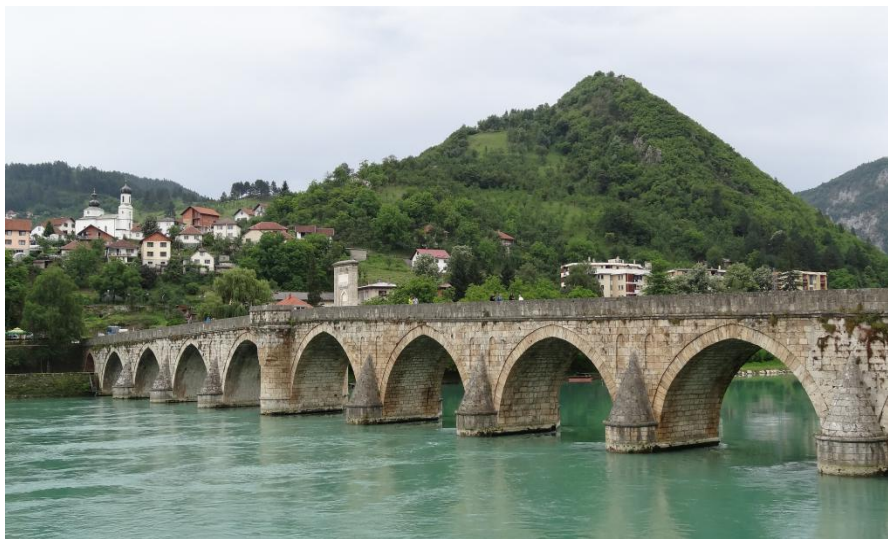
波黑维舍格勒老桥

波黑旅游业近几年发展速度较快，政府大力支持，并积极吸引外资。波黑希望继续加强与中国的旅游合作，商签旅游合作协议，实现双边旅游往来的常态化，同时欢迎中国企业对波黑的旅游设施项目进行投资。