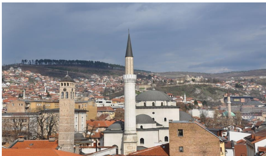
萨拉热窝市中心的贝戈瓦清真寺

波黑极具特色的大众传统风味小吃：一是“切瓦比”（一种牛羊肉丸拌洋葱夹面囊饼）；二是布雷克馅饼。