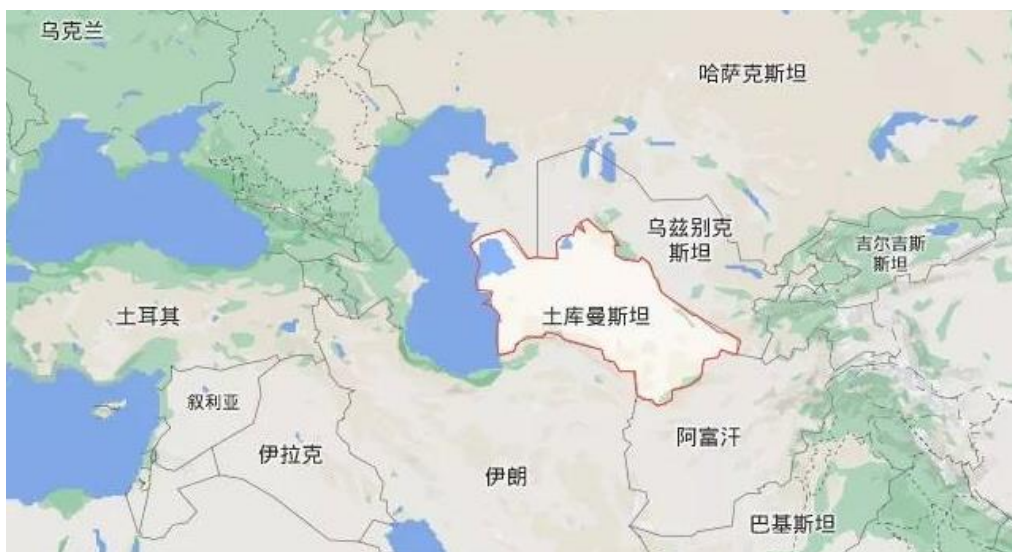
土库曼斯坦地理位置

1991年10月27日，土正式宣布独立，改国名为“土库曼斯坦”，并于同年12月21日加入独立国家联合体（简称“独联体”）。1992年3月2日，土加入联合国。1995年12月12日，第50届联合国大会通过决议，承认土为永久中立国。2005年8月，土宣布退出独联体，仅保留联系国的地位。