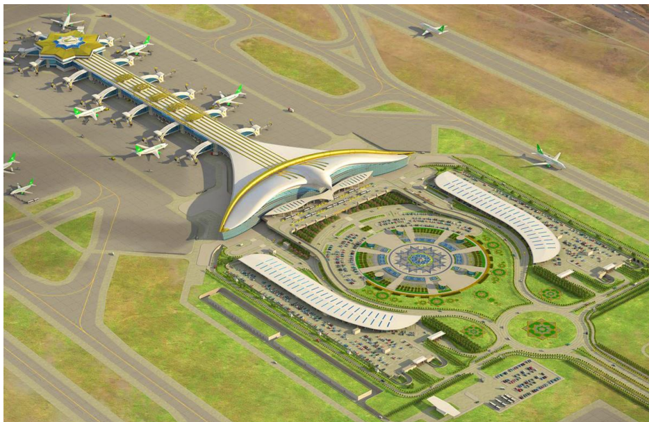
阿什哈巴德国际机场

土库曼纳巴特国际机场（IATA代码：CRZ，ICAO代码：UTAV）于2018年2月正式投入使用，造价4.77亿美元，旅客吞吐量近500人次/小时。克尔基国际机场（IATA代码：KEA，ICAO代码：UTAE）位于列巴普州，2019年5月开工建设，2021年6月正式落成。航空港占地200公顷，拥有2700米长、45米宽的起降跑道、4个直升机停机坪、1700多平方米的航站楼、空中交通管制中心等设施，旅客吞吐量预计达每小时100人次。2025年5月，位于巴尔坎州首府的巴尔坎纳巴德新国际机场正式启用。