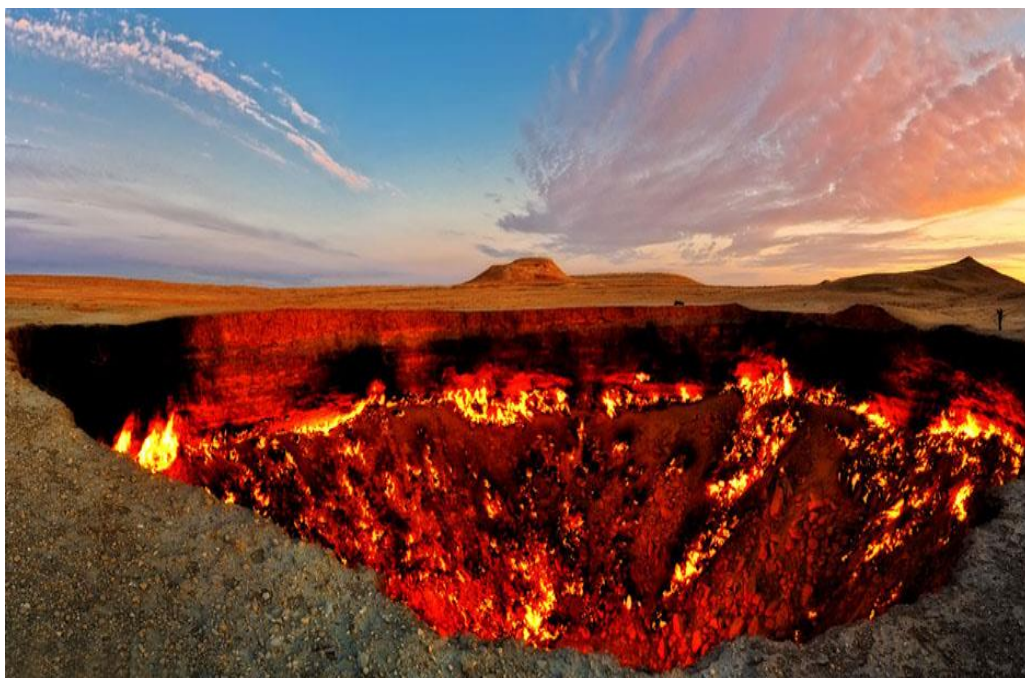
燃烧50年的天然气坑——“地狱之门”

(4) 农业部。主管农业和土地资源利用等事务；研究拟定农业和农村经济发展战略、中长期发展规划；拟定农业开发规划并监督实施；研究拟定农业产业政策；提出有关农产品及农业生产资料价格、关税调整、大宗农产品流通、农村信贷、税收及农业财政补贴的政策建议；组织起草种植业、畜牧业、渔业和乡镇企业等农业各产业的法律、法规草案；组织国内生产；负责进口种子、农药、兽药、有关肥料等产品的登记和农机安全监理工作；承办政府间农业涉外事务，组织有关国际经济、技术交流与合作等。