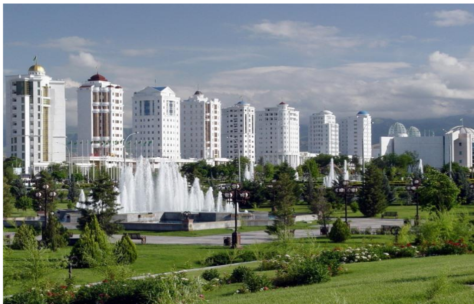
白色大理石城——土库曼斯坦首都阿什哈巴德

西部最大城市、里海东岸港口城市，里海附近区域盛产石油，建有大型炼油厂，还有船舶修理厂、热电厂及鱼类、肉类加工厂等；（5）阿尔卡达格，国家级新城，位于阿什哈巴德以南30公里，是土第一个以“绿色、智慧”理念建设的城市，拥有电动公交、智慧停车场、小型光伏和风力发电等设施。