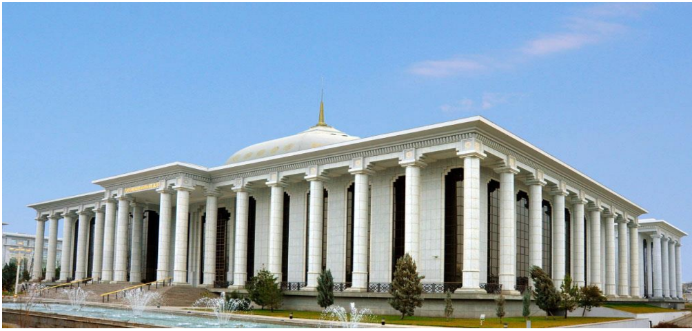
土库曼斯坦议会大楼

【议会】 土议会是国家立法机构，由125名经选举产生的议员组成，议员任期五年。其主要职能是通过宪法、法律并对其进行修改和补充，监督法律的执行，确定总统、议会的选举，通过内阁活动纲领，批准国家预算以及土参与的国际条约等。2023年4月，杜尼亚戈泽尔·古尔马诺娃当选议长。