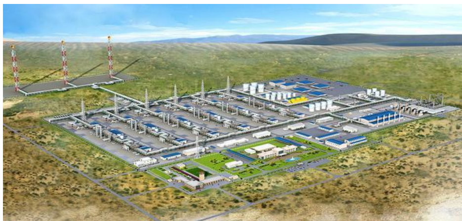
世界第二大单体气田-土库曼斯坦复兴气田

土秉持永久中立政策，对外合作亦注重保持平衡，且愿意选择有过合作历史的外国企业再次合作。因此，土在各资源领域都有相对固定的合作企业。土油气开发和技术服务领域主要合作伙伴为中国、意大利、俄罗斯、马来西亚、阿联酋等国企业；天然气化工领域主要合作伙伴为日本和韩国企业；钾盐开采领域主要合作伙伴为白俄罗斯企业。