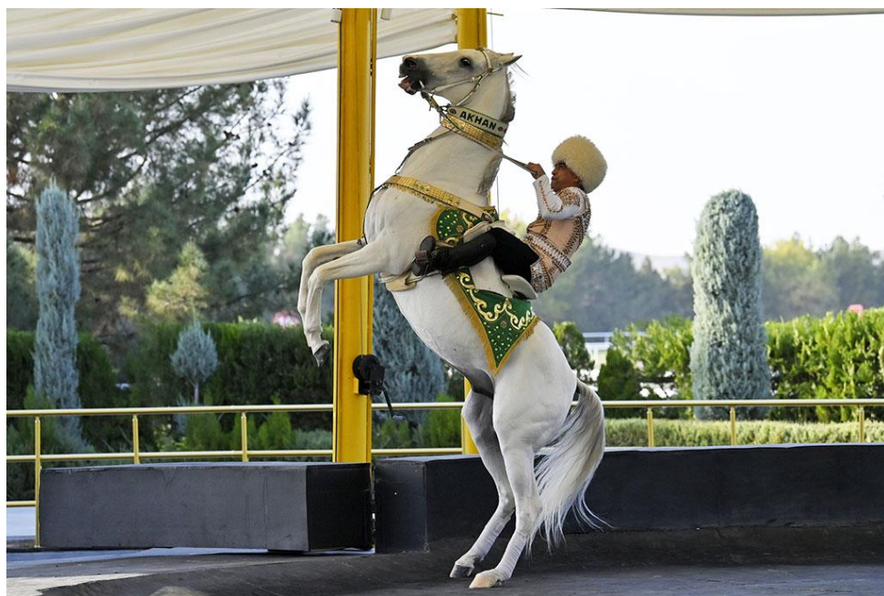
汗血宝马——阿哈尔捷金马（土库曼斯坦国宝之一）

独特的地域文化形成了土库曼人民世代相传的风俗习惯和在为人处事、待人接物中善良淳朴、热情好客的美德。土库曼人很重视宗教传统节日，每年的古尔邦节（亦称宰牲节）在所有节日中占有很重要的地位。节日期间，土库曼人宰杀牲畜以祭祀亲人，妇女们聚在一起猜谜，姑娘和小伙子们则荡秋千。土库曼人很重视亲戚和邻里关系，家庭观念极强，婚丧嫁娶及各种节日时，人们相互探访，拉拉家常，分享美食。