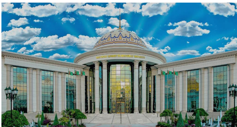
土库曼斯坦国立马赫图姆库里大学

【教育】 土实行十年制义务教育。中小学教育免费，高等教育收费，但费用较少。当地教育体系由学前教育、小学教育、中等教育、中等专业技术教育和高等教育组成。土库曼斯坦全国有中小学1900多所、中等职业学校45所、高等院校26所，此外还有数十所职业技校，各类学校在校生总人数超过170万人。当地著名大学有国立马赫图姆库里大学、阿扎季世界语言学院、工学院、国家油气学院、国家通信建设学院等。