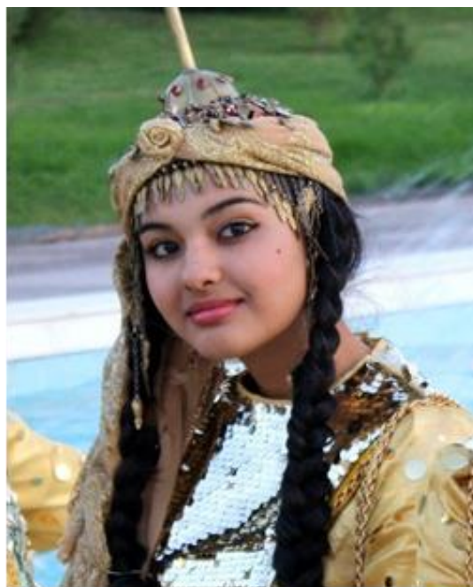
穿传统服饰的土库曼族女孩

土主要民族有土库曼族(占总人口的86.7%)、乌兹别克族(9.1%)、俄罗斯族(1.6%)，此外，还有俾路支、阿塞拜疆、亚美尼亚、哈萨克、波斯、鞑靼等62个民族（共2.6%）。在土华人较少，主要是在土油气领域的中资企业员工。