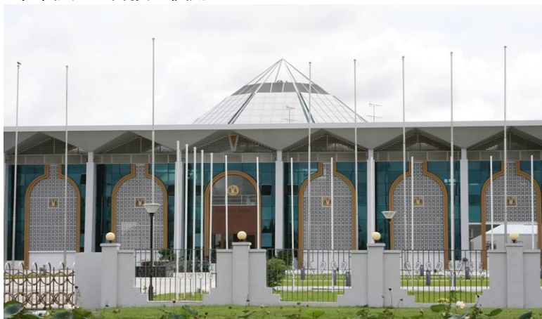
中国援建的钟亚瑟会议中心（原国际会议中心）

中国援建的中圭友谊公园项目已于2024年7月开工，预计于2026年年初完工并投入使用。