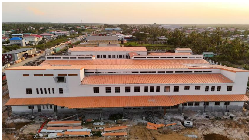
地区医院项目——Enmore医院（建设中）