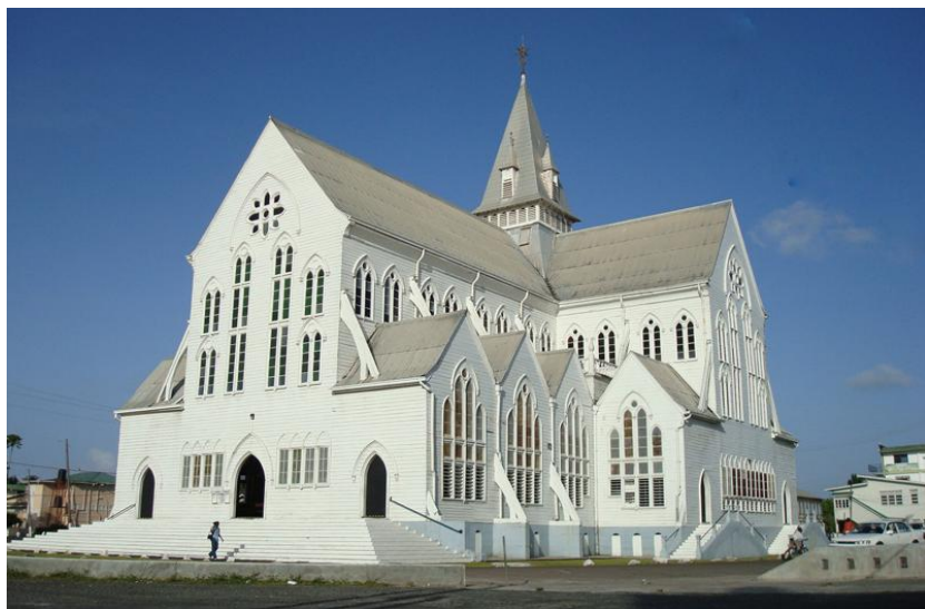
圣乔治大教堂——世界上最高的木质教堂

https://www.state.gov/reports/2023-report-on-international-religious-freedom/guyana/