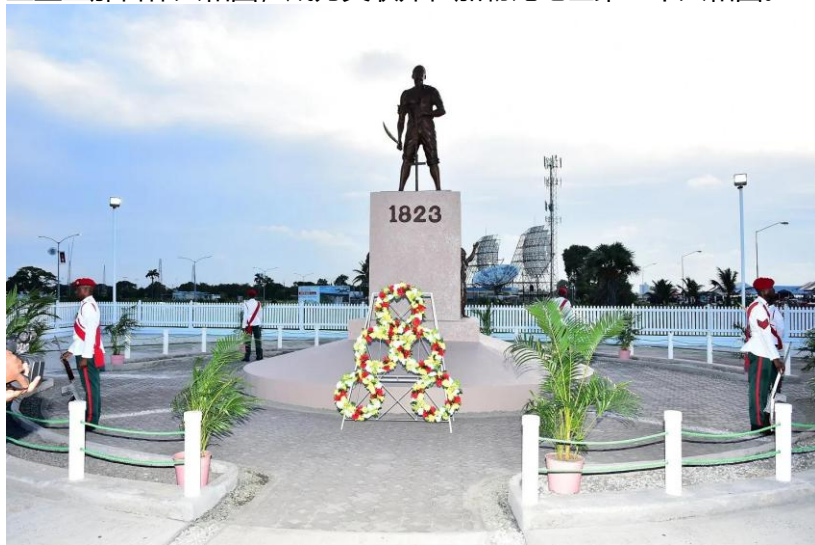
1823 年德梅拉拉起义纪念碑

【简况】公元9世纪起，印第安人开始定居在圭亚那。15世纪起，西班牙、荷兰、英国、法国等殖民者先后入侵。16世纪晚期，荷兰人抵达圭亚那，从事热带染料、树脂和木材贸易，并相继建立“埃塞奎博”“伯比斯”和“德莫拉拉”殖民地。1814年，荷兰将殖民地转让给英国，1831年，英国将3块殖民地合并，取名英属圭亚那。1953年，圭亚那取得内部自治地位。1966年5月26日宣告独立，改称圭亚那 (Guyana)，印第安语意为“多水之乡”。1970年2月23日，成立圭亚那合作共和国，成为英联邦在加勒比地区第一个共和国。