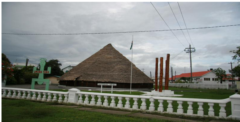
大草棚——圭亚那著名景点