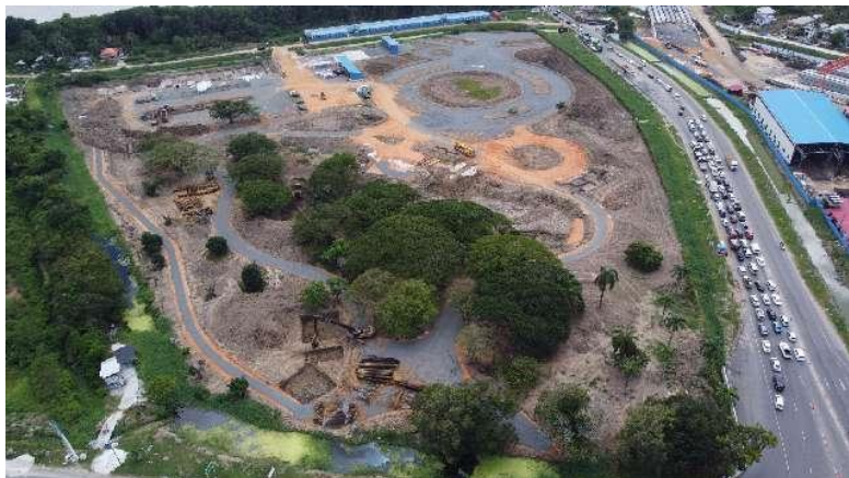
援圭亚那中圭友谊乔维拉公园（建设中）