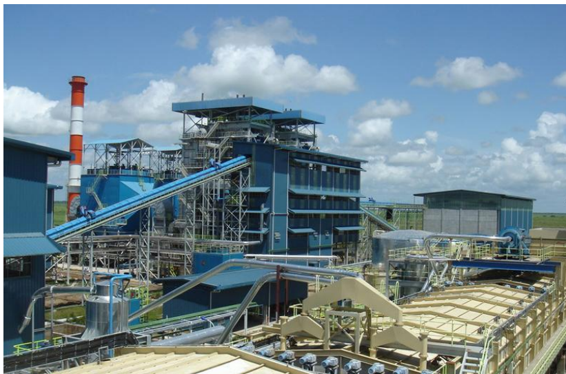
博赛矿业铝矾土厂——圭林登市最大中资企业