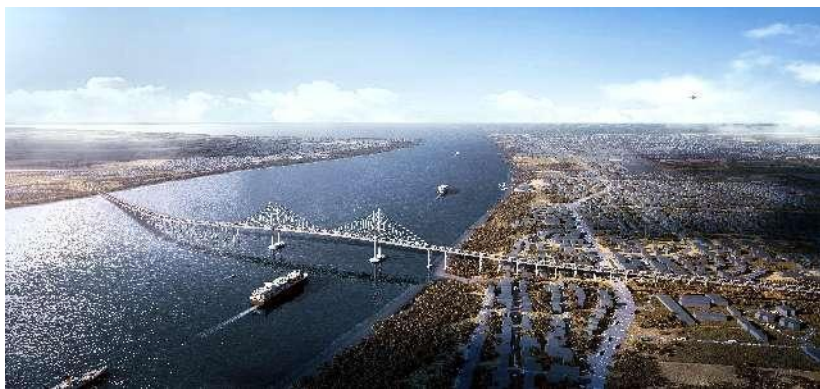
德梅拉拉河大桥效果图（建设中）